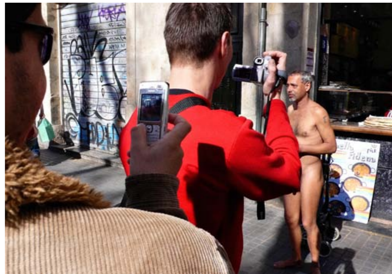
KONTRAST SITUACE znásoben zachycením displejů fotografujících, o nichž je vlastně snímek především... Barcelona, 2008.