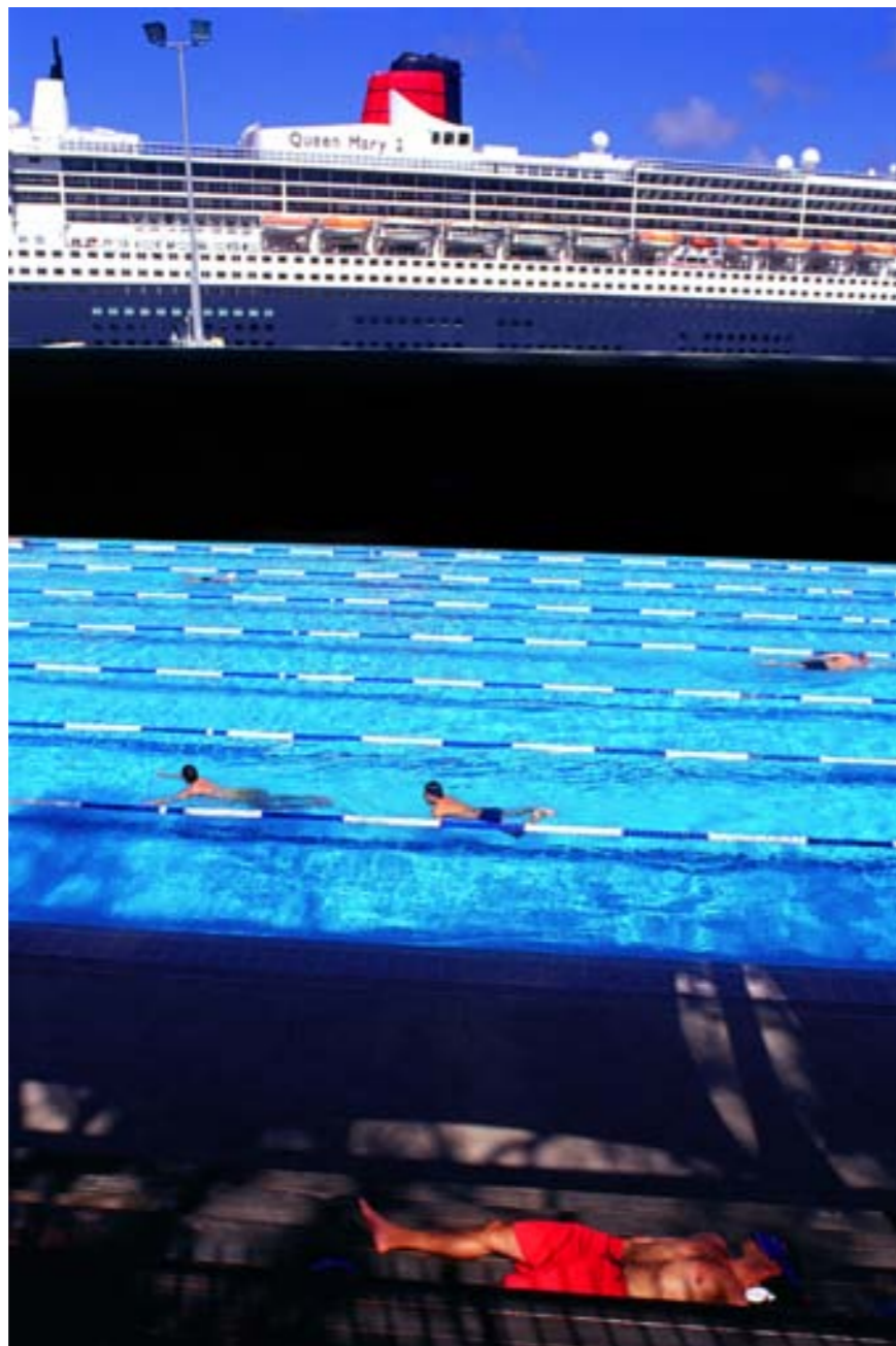
KONTRAST BAREV, KONTRAST DÉJŮ, KONTRAST HMOT... Skvělé „kulisovité“ rozčlenění prostoru. Sydney, 2007.

Fotograf nemá se svým přístrojem obtěžovat, neměl by ani budít zdání, že obtěžuje a že je indiskrétní. Požádání o souhlas s focením ovšem často vede k úplnému