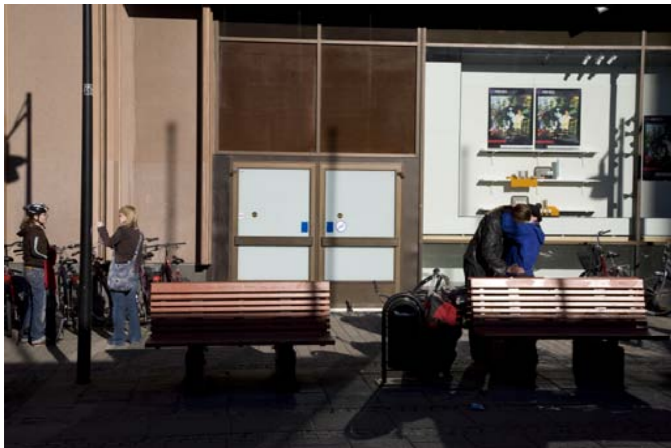
KOUZLO NEZÁVISLÝCH DĚJŮ. Na ulici probíhá bezpočet situací, přičemž je zvlášť zajímavé vidět mezi nimi nějaký kontrast, či je naopak vnímat jako autonomní děje sjednocené jen místem, časem, barevně stejnorodým pozadím...

Každodenní všední ruch ulice tvoří lidé, které se fotograf snaží zachytit buď v pohledech typických pro dané místo, nebo jako vyjádření svých vlastních pocitů z prostoru a okolního dění. Záleží na jeho naturelu a fotografických zkušenostech, jak je schopen se zorientovat, co dokáže vidět a co z celku zvýrazní.