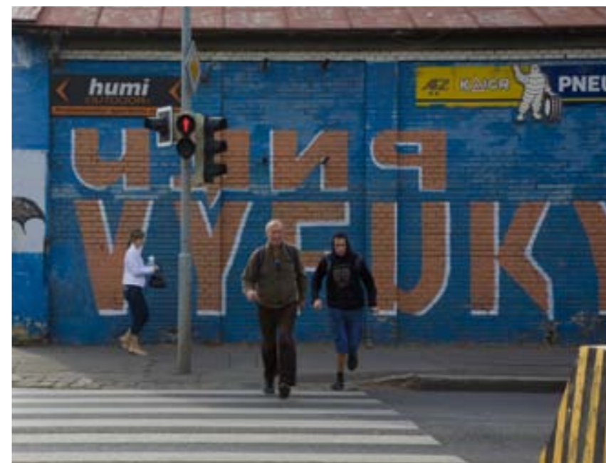
BIZARNÍ POZADÍ SE ZAJÍMAVÝM DĚJEM. Někdy se vyplatí před zajímavě vypadajícím pozadím chvíli čekat a ono se něco stane. Smíchov.

to dá třeba i dosti nevybíravě najevo. Na řadě míst – i turistických – se nesmí fotit z tripodu. Prostředí ulice má i své právní aspekty.