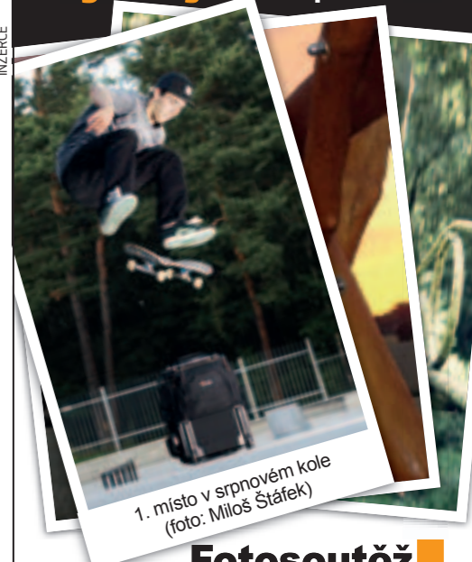
1. místo v srpnovém kole

technickou dokonalost, může využít malých nenápadných kompaktních. Z jejich nabídky bych pro tyto účely osobně dal přednost zejména takovým, které jsou vybaveny proti vodě, pádům a prachu, jmenovně například Canon PowerShot D10, Olympus Stylus Tough-8000, Panasonic Lumix DMC-FT2 a třeba i Pentax Optio W80 s velmi tenkým tělem.