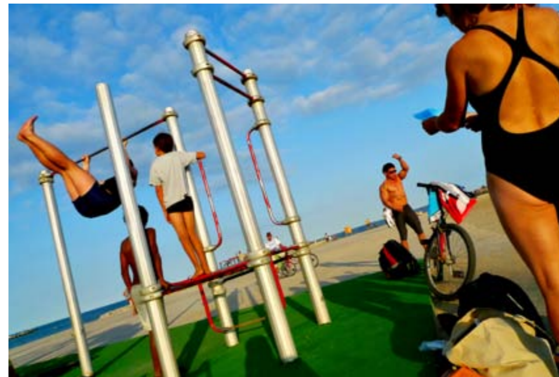
POHYB A KLID , dynamika zvýrazněna náklonem horizontu a zvýšenou saturací. Barcelona, 2009.

Volba fototechniky pro snímky ulice je do značné míry i měřítkem naturelu fotografa. K přístrojům zmíněným na s. ... připojme ještě ultratenký kompak Sony Cyber-shot DSC-TX5 s řadou osobitých funkcí, který má ovšem pouze dotykový displej. Při počítačových úpravách se v současné době u záběrů z ulice často zvyšuje saturace, což může zvýraznit kompozici i myšlenku snímku.